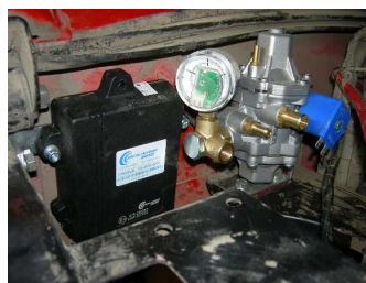
Reduktor tlaku plynu, vlevo umístěna řídicí jednotka plynového systému