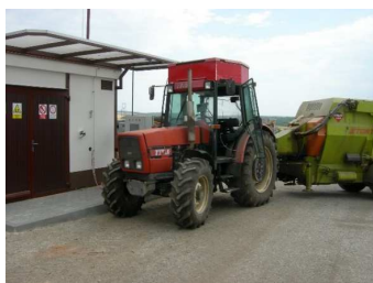
Traktor ZETOR 10540 (FM) DUÁL při zajíždění k pilotní plnicí stanici (bio)CNG CG 17 s technologií společnosti GC GASCONTROL Havířov

Analýza používaných olejů a paliv – SGS Czech Republic, s.r.o. – divize paliv a maziv