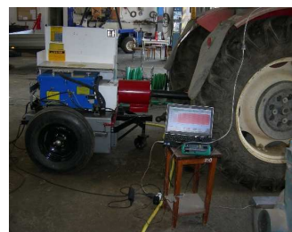
Programování trojrozměrné palivové mapy pro optimální poměr motorová nafta – (bio)CNG s využitím mobilní výkonové brzdě AW NEB 400