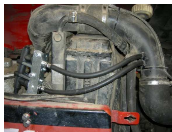
Vstříkovací jednotky plynu napojené na sací potrubí vzduchu před turbodmýchadlo