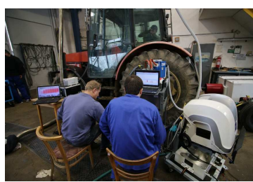
Měření výkonových a emisních parametrů traktoru společně s Centrem vozidel udržitelné mobility ČVUT, fakulta strojní, Praha a TÜV SÜD Roztoky u Prahy. Emisní třída traktoru ZETOR 10540 STUPEN I.