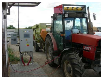
Plnění traktoru ZETOR 10540 (FM) DUÁL stlačeným plynem