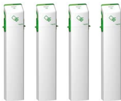
Systém pro nabíjení

Správa pro nabíjení v sobě integruje službu nastavení úrovně priorit pro plánování nabíjení „elektromobil od elektromobilu“ a zajištění jeho dostupnosti.