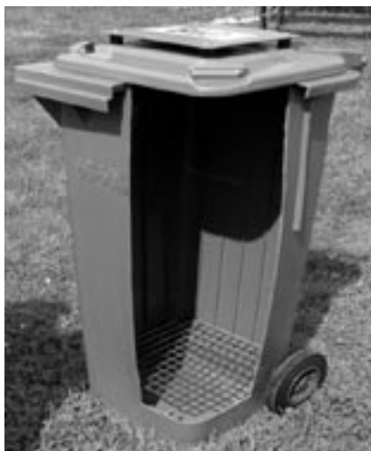
Speciální nádoba na sběr bioodpadů

Komunální bioodpad má více zdrojů výskytu. Jedná se zejména o odpad z domácností, zahrad, veřejné zeleně (parky, hřiště apod.) a ostatní specifické bioodpady vyskytující se na území obce. Jedná se například o odpady z některých živnostenských provozů (obchody s květinami, pekárny a obchody s potravinami, restaurační zařízení, hotely, školní a firemní jídelny apod.).