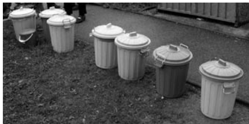
Sběr kuchyňských odpadů do malých nádob

V České republice je v současné době biologický odpad odděleně sbírán a kompostován v několika obcích (v různé míře a rozličnými způsoby), např. v Bystřici nad Pernštejnem, Kroměříži, Nové Pace, Písku, Plzni, Praze 12, Rýmařově, Strážnici, Uherském Hradišti a dalších. Celkově je možno stav sběru bioodpadu v ČR považovat za stadium pilotních projektů.