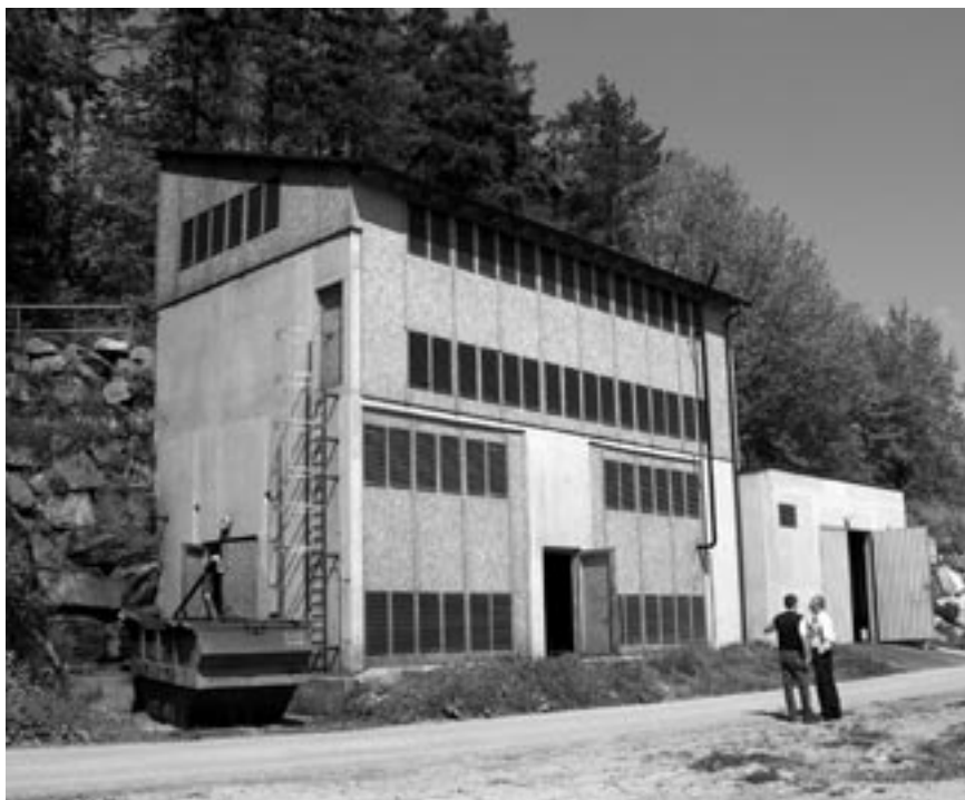
Teplárna s výkonem 420 kW, z toho 150 kW elektrických. Druhé patro slouží jako sklad paliva a je přístupné z druhé strany budovy ze silnice.

Druhá exkurze zavedla v pátek 11. května 16 členů CZ Biomu do příhraničního rakouského města Raabs nad Dyjí, v jehož blízkosti leží příjemný hotel s malou vodní elektrárnou, kterou zhruba před rokem doplnila malá teplárna na dříví. Teplárna vyrábí elektrickou energii ze dřevoplynu. Zdrojem energie je